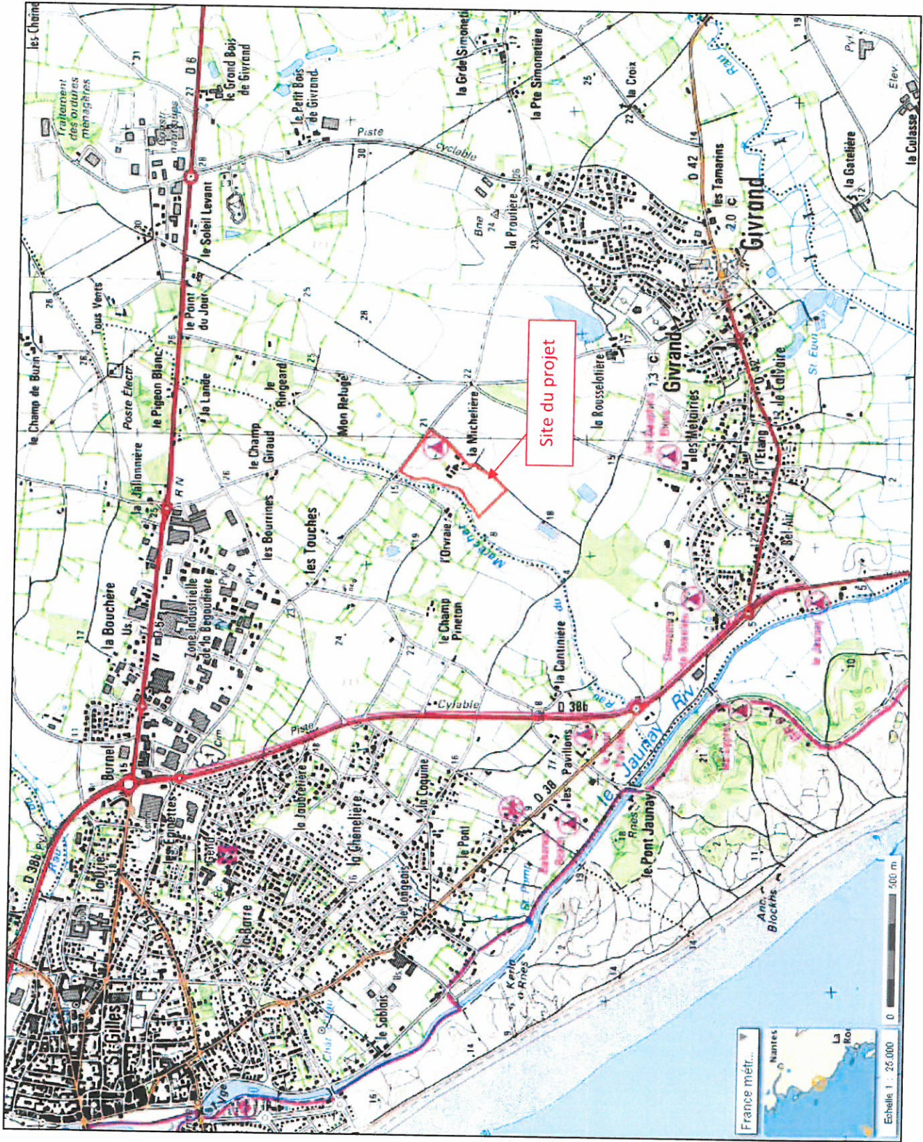
Annexe 2 : Localisation du projet sur carte IGN (Echelle 1/25 000)