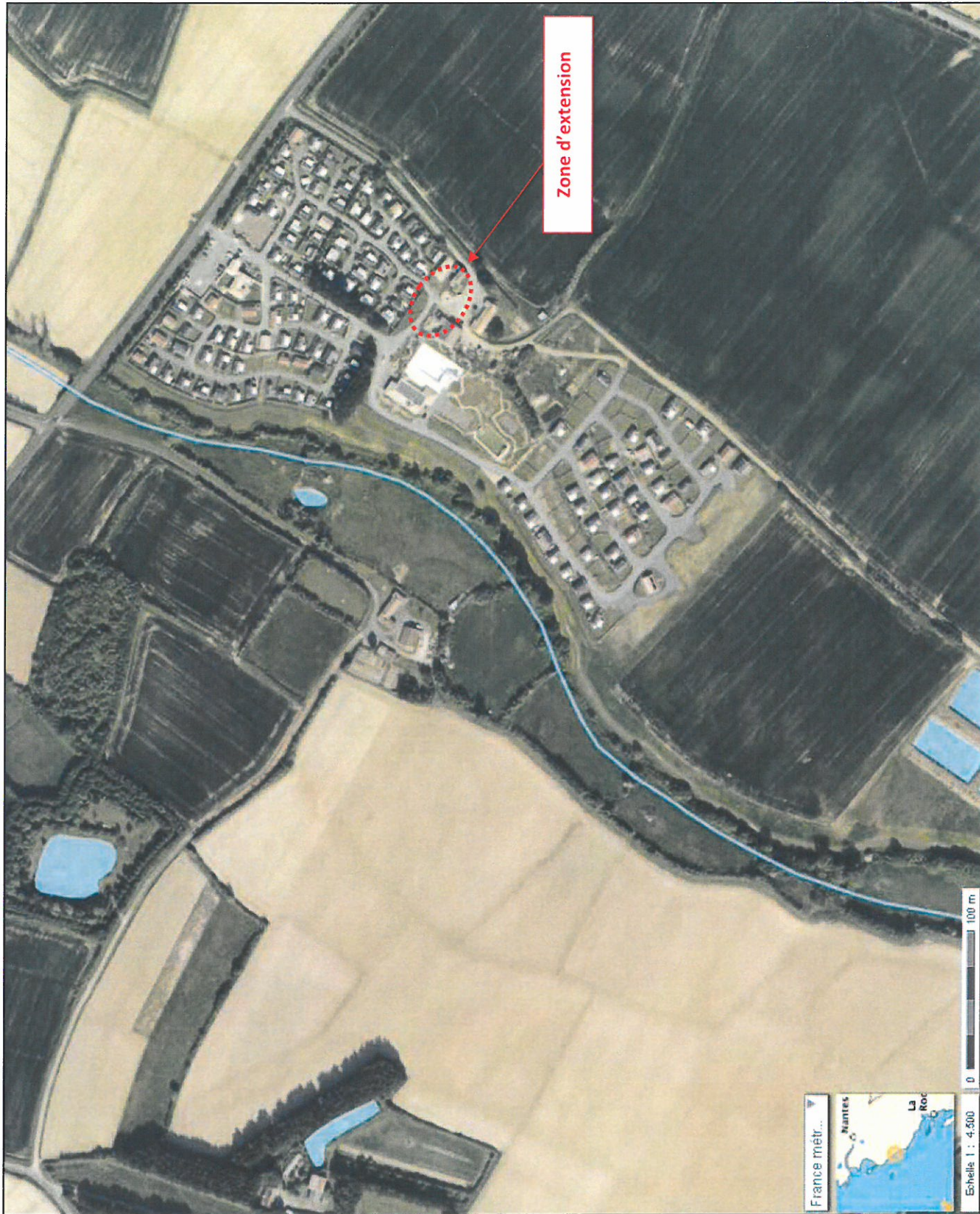
Annexe 5 : Plan du site et des abords