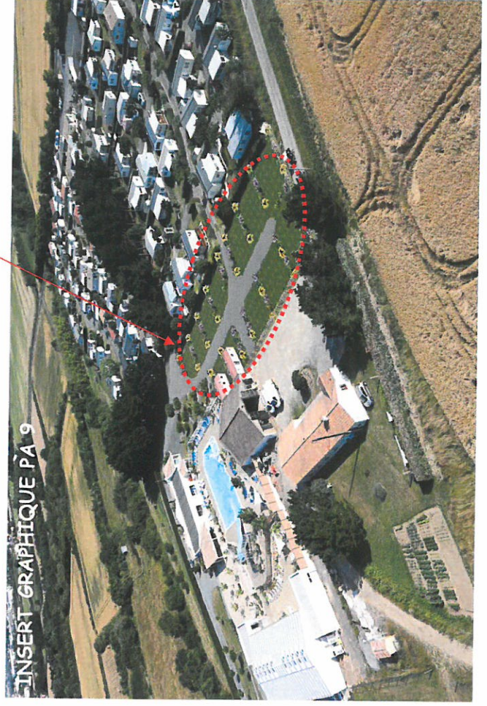
Annexe 6 : Vues aériennes avant et après travaux