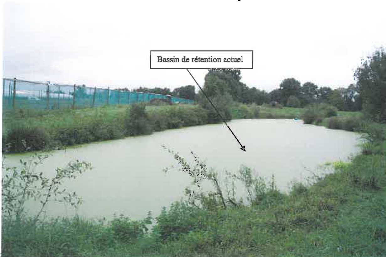
Photo du bassin de rétention des eaux pluviales

La collecte des eaux de ruissellement des serres multi chapelles se fait par l'intermédiaire de réseaux des eaux pluviales. Ils sont dirigés vers un bassin de rétention en eau situé au sud-est. Les eaux de cet ouvrage s'écoulent ensuite vers un ruisseau temporaire affluent du ruisseau de l'Île Bernard (localisé au sud). Les caractéristiques du rejet sont les suivantes :