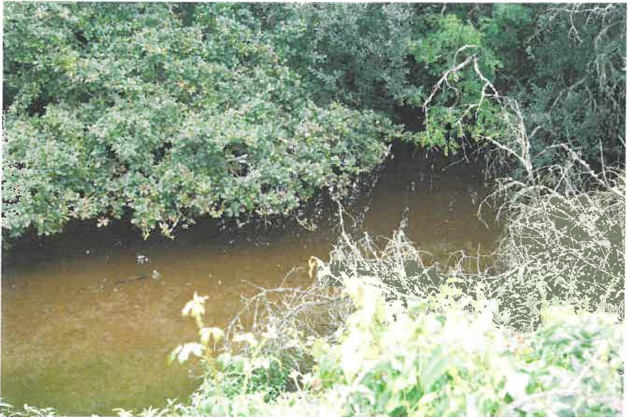
Photo du ruisseau temporaire limite est (photo n°6 du contexte environnemental)

Le projet de serres sera édifié dans le contexte paysager du site avec des serres et une exploitation existantes.