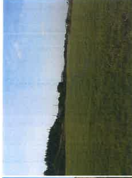
3- Vue sur les parcelles agricoles