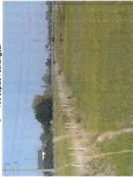
4- Vue sur les parcelles agricoles et le réseau de fossé