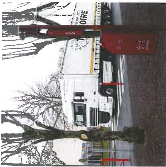
CIRCULATION PUIDS LOURD EN CENTRE BOURG