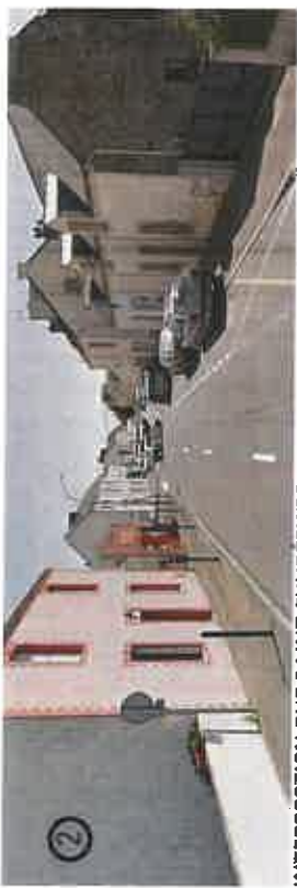
INTERSECTION RUE SAINT-EXUPERY/RD 971 - MONTOIR DE BRETAGNE