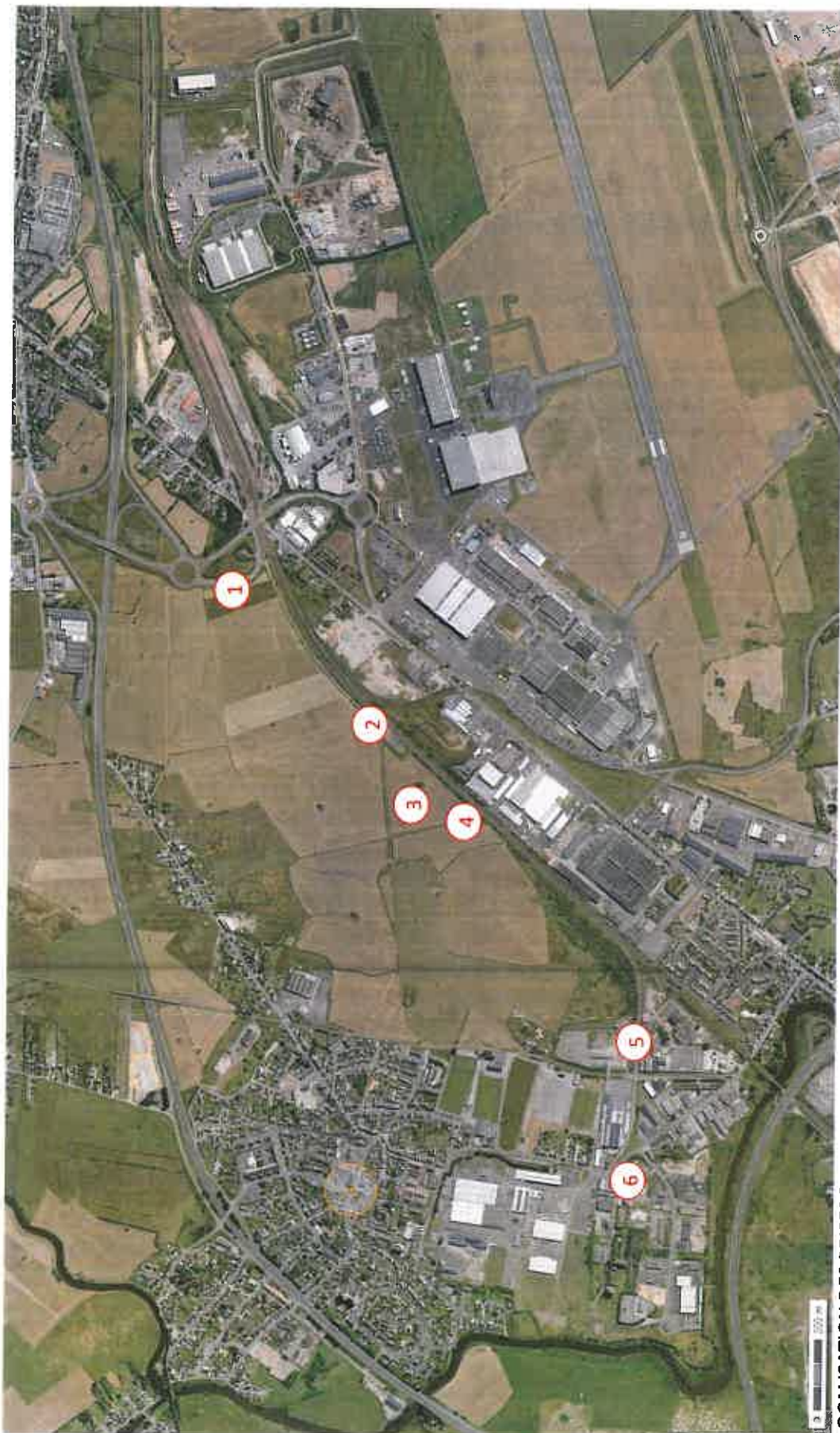
LOCALISATION DES PRISES DE VUES