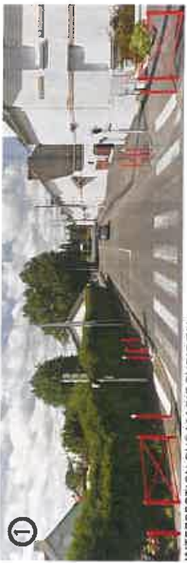
INTERSECTION RUE MARIE CURIE/RN 171 - TRIGNAC