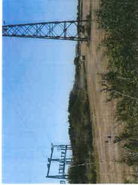
2- Vue sur les parcelles agricoles et le poste relais