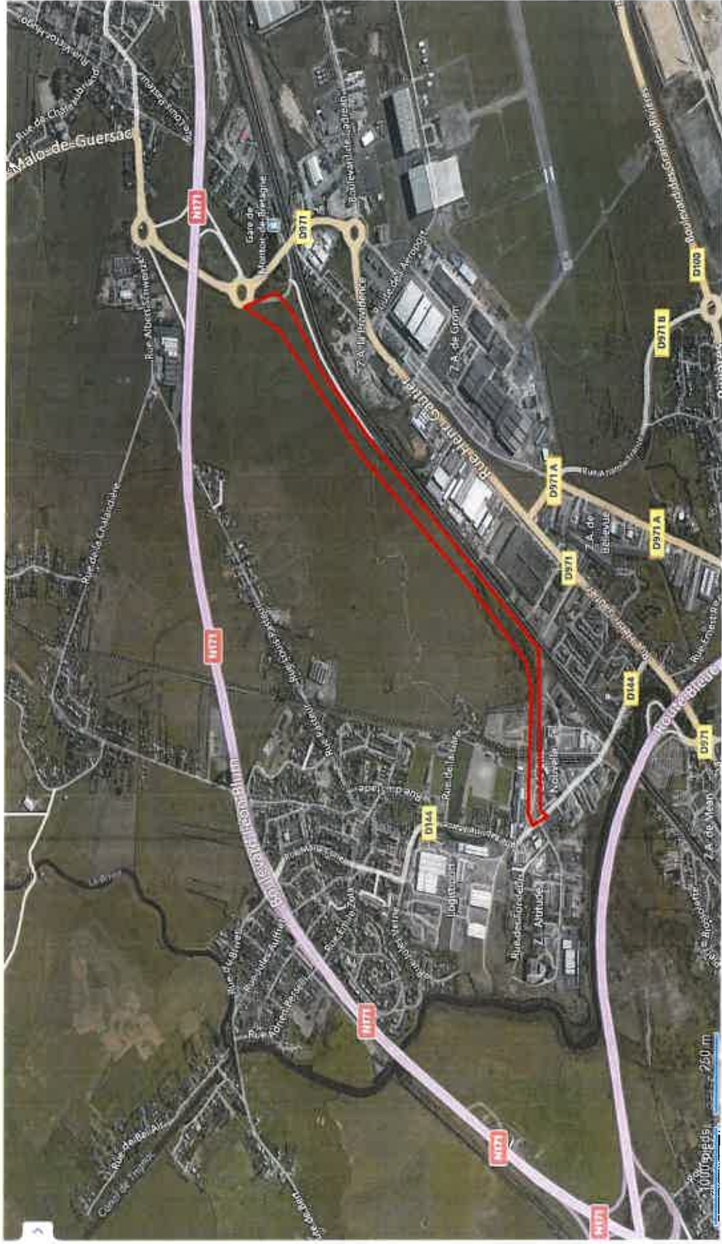
VUE AERIENNE DU SITE