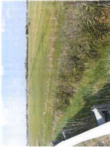
1- Vue depuis l'échangeur