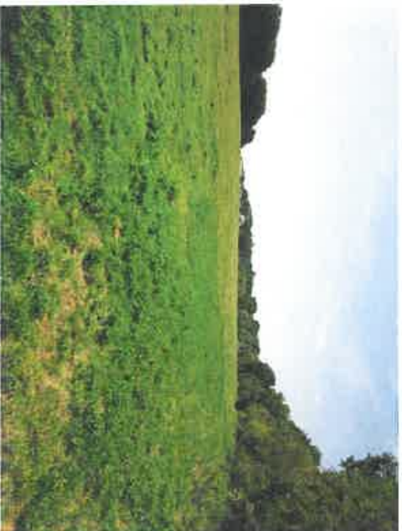
Chemin creux central/