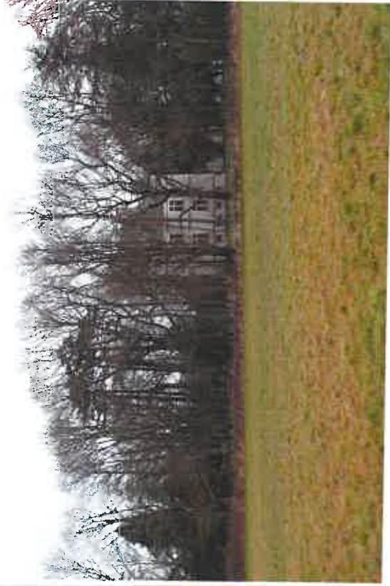
Photo 2 : Vue vers le nord (château de Therbé et la haie séparative)