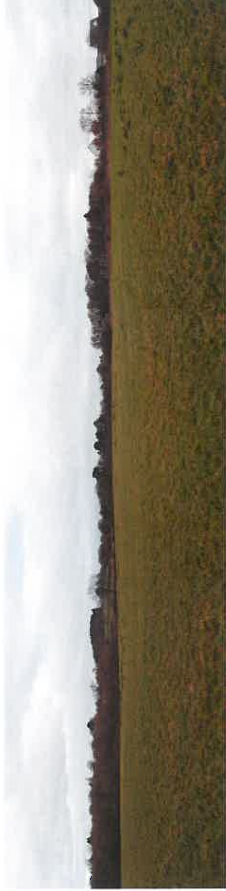
Photo 7 : Panorama pris sur le site d'implantation, du sud vers le nord