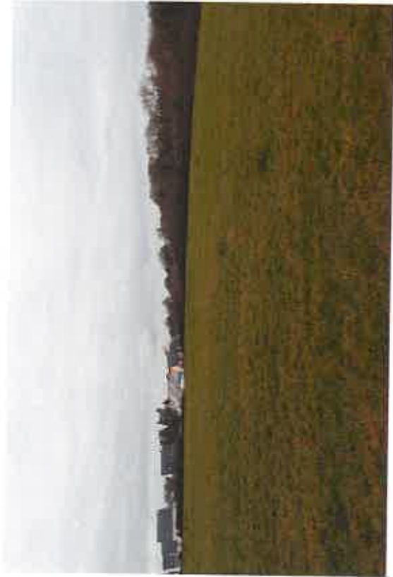
Photo 1 : Vue depuis le site d'implantation vers le sud (zone résidentielle)