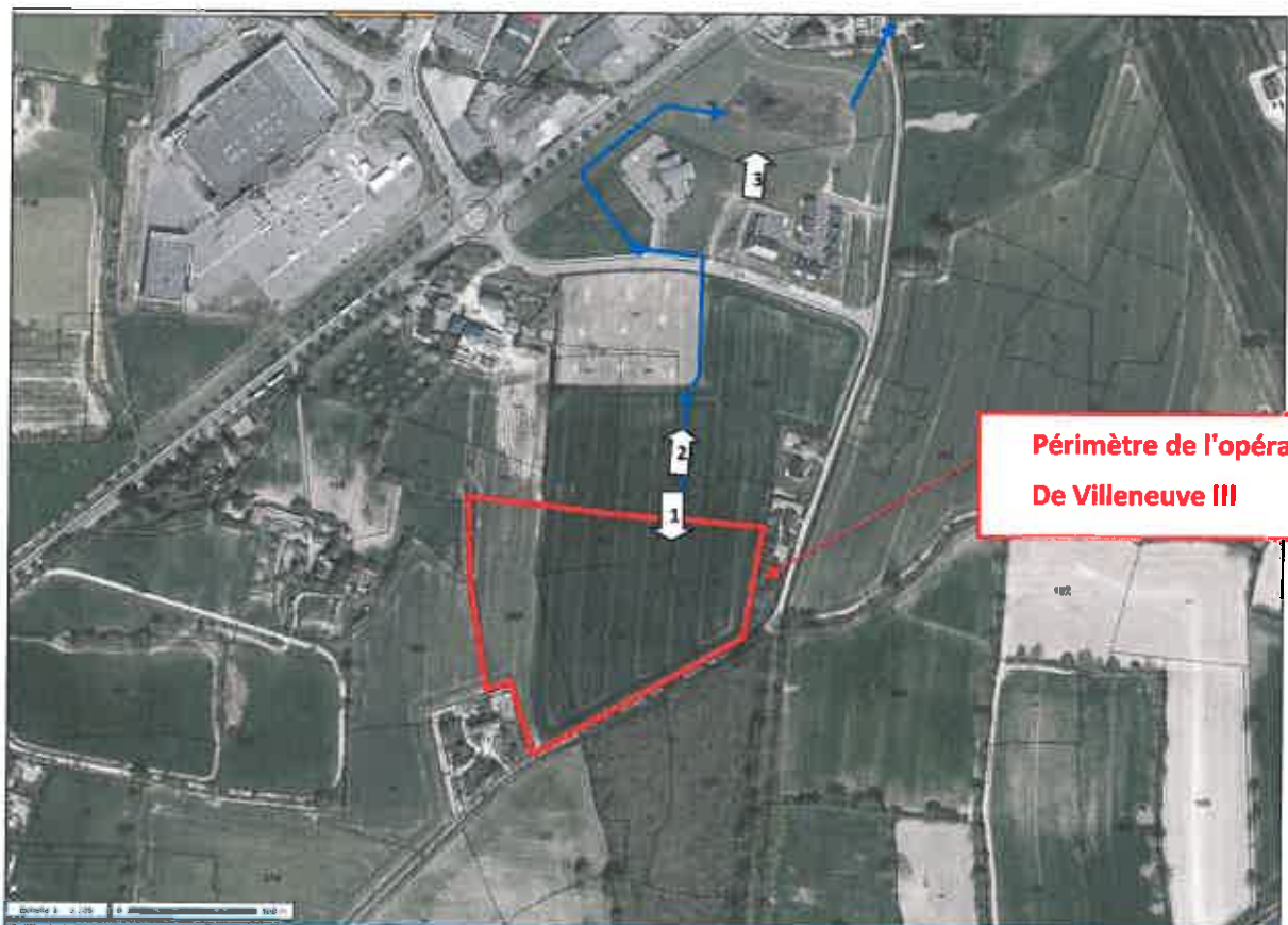
Localisation sur la photo aérienne

ZA "Villeneuve III" - Syndicat mixte du Pays de Craon