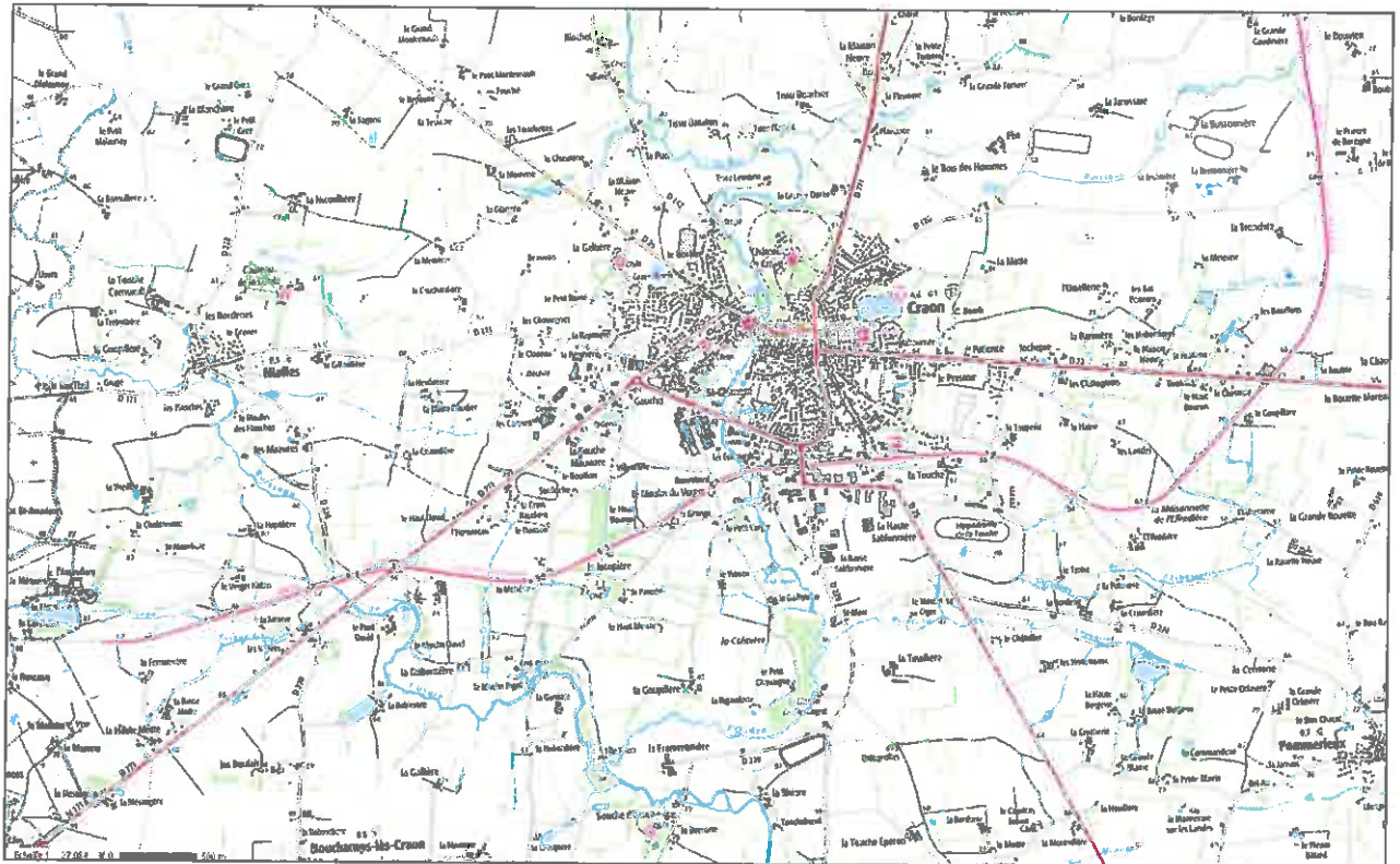
Plan de localisation du projet au 1/25000