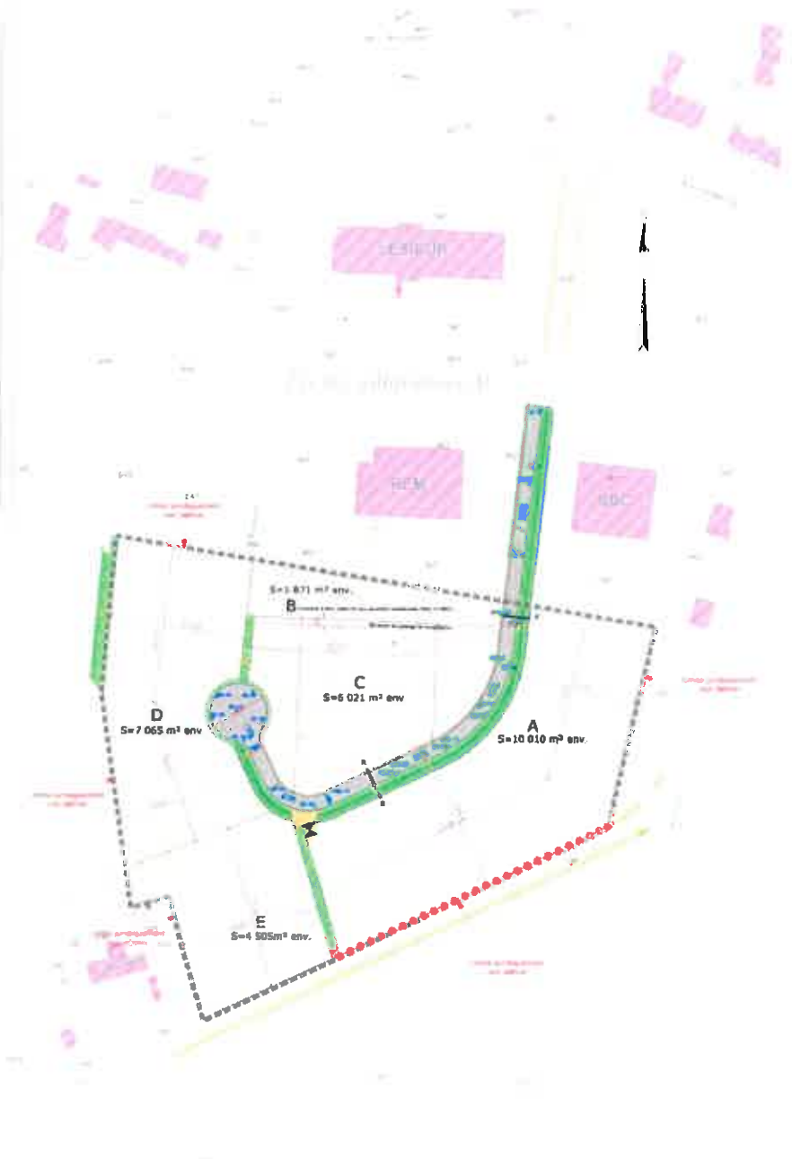
Plan de projet