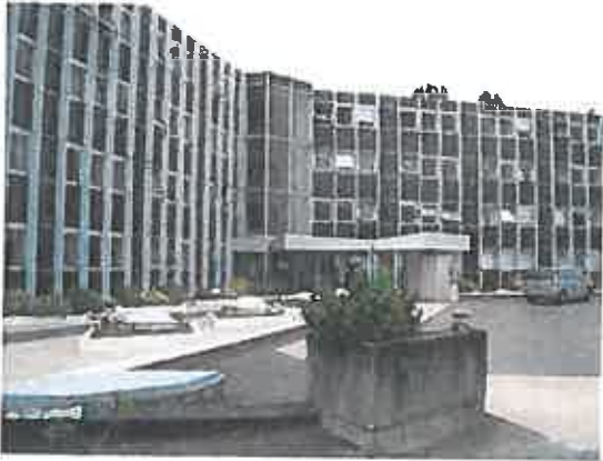
Vue V1 depuis le 46, rue du Port Boyer