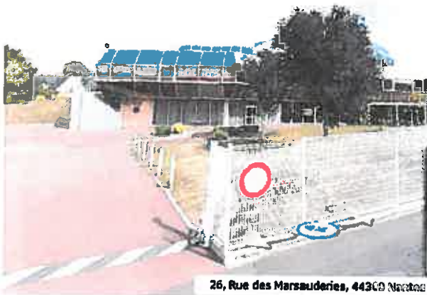
Vue V3 depuis le 26, rue des Marsauderies