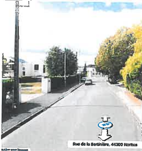
Vue V4 depuis la rue de la Bertinière