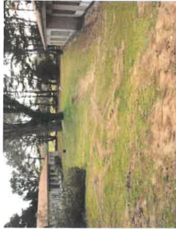
Vue 1 : Etat existant