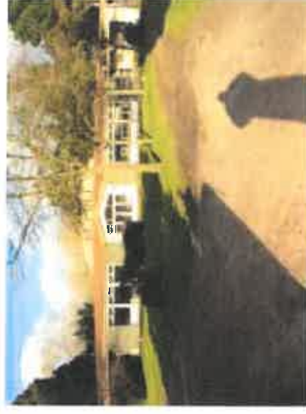
Vue 5 : Bâtiment existant et conservé dans l'opération