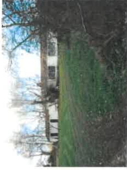
Vue 3 : Maison au Nord de l'opération