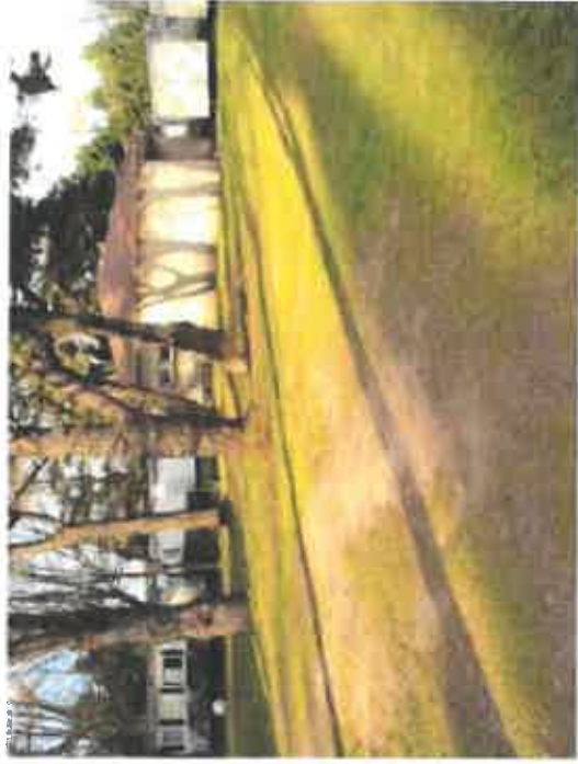
Vue 0 : Etat existant