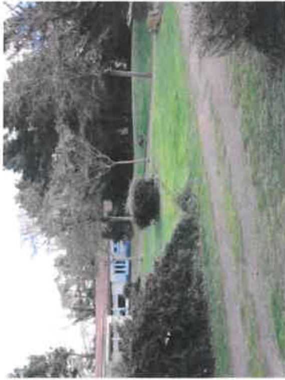
Vue 7 Végétation existante