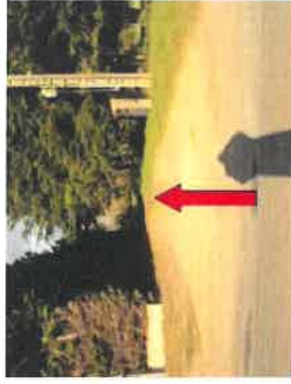
Vue 9 : Accès au lot A. passage