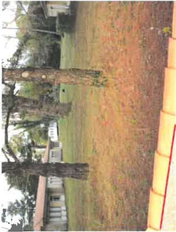
Vue 6 : Végétation qui sera conservée en fonction des implantations

Photos effectuées par la société AMEAS Novembre-Décembre 2013