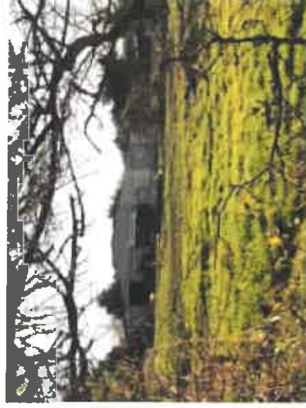
Vue 4 : Exploitation au Sud-Ouest de l'opération