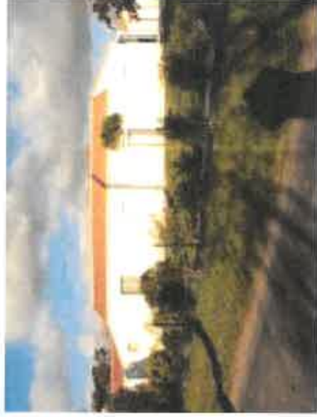
Vue 2 : Maison à l'Est de l'opération