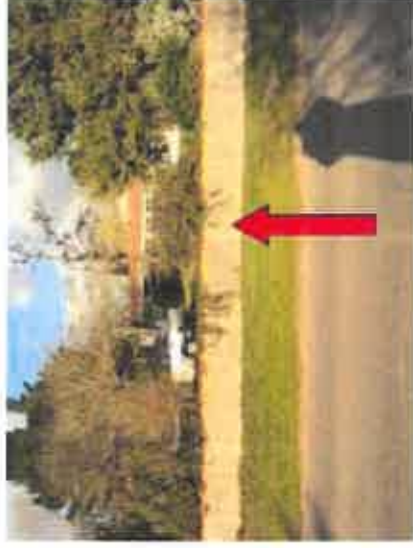
Vue 8 : Entrée à partir du chemin des Roselières