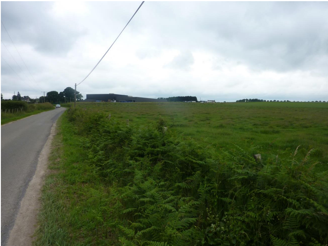
Photo 2 : vue depuis l'actuel RD 508 au niveau du début de la nouvelle voie