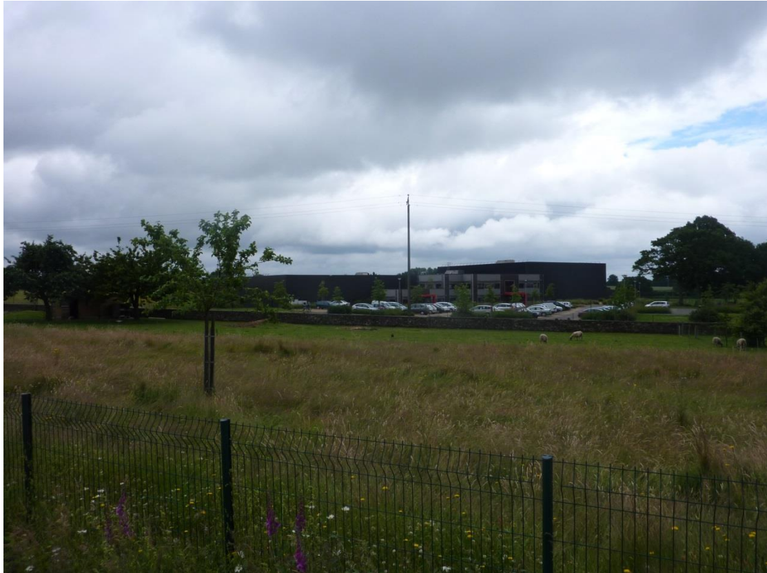
Photo 4 : vue depuis la RN 162 avec l'entreprise MP²PLV qui masque les visions