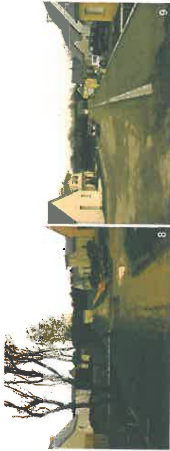
Lotissement communal de la Noé