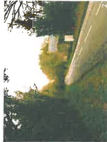
RD 52B / route de la Noë