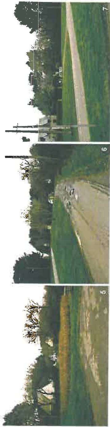
Espaces urbanisés le long de la RD 52 / route de Kerlagadec