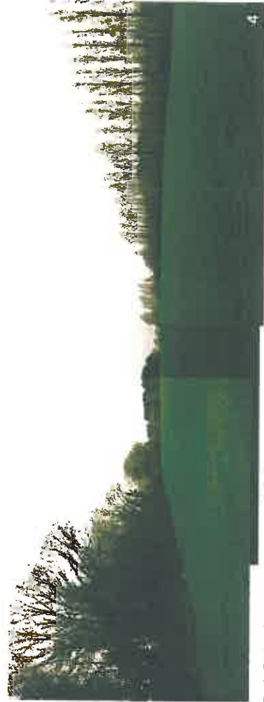
Terrain d'assiette du projet / Haies existantes - partie nord