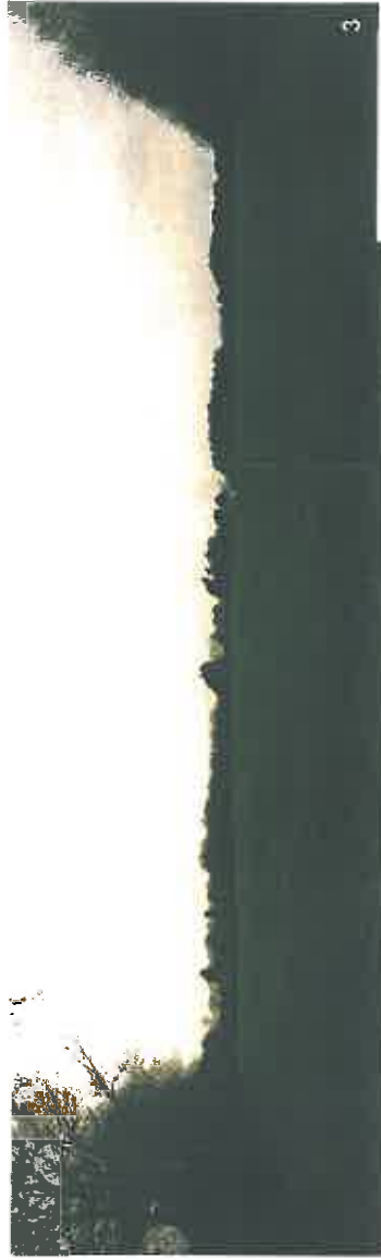
Terrain d'assiette du projet / Haies existantes - partie Sud