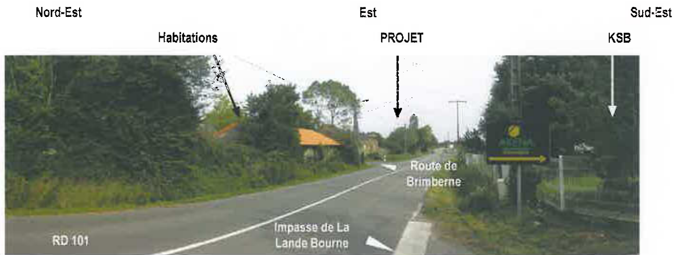
01 - Vue depuis l'intersection de la RD 101 et l'impasse de La Lande Bourne, vers l'Est.