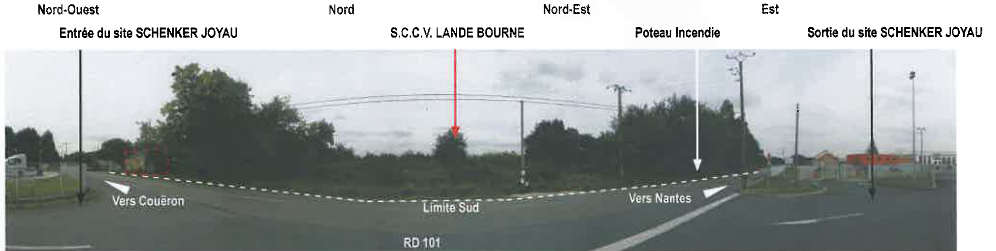
06 - Vue depuis l'entrée du site TRANSPORT SCHENKER JOYAU, vers le Nord.

DEMANDE DE PERMIS DE CONSTRUIRE - S.C.C.V. LANDE BOURNE CONSTRUCTION D'UN BATIMENT D'ACTIVITE A COUËRON (44220) S.A.R.L. D'ARCHITECTURE ARCHI-FACTORY / JEAN-PIERRE MADELAINE - ARCHITECTE D.P.L.G.