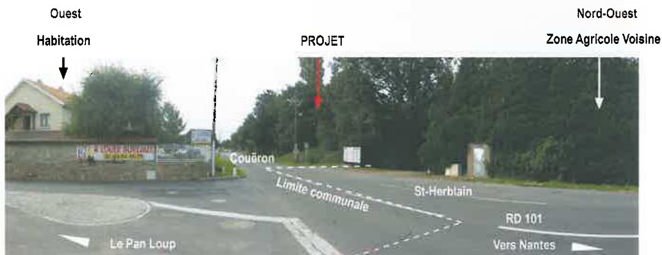
02 - Vue depuis l'intersection entre la RD 101 et la Rue du Lieu-dit Pan Loup, vers l'Ouest.

DEMANDE DE PERMIS DE CONSTRUIRE - S.E.C.V. LANDE BOURNE CONSTRUCTION D'UN BATIMENT D'ACTIVITES / COUËRON (44220) S.A.R.L. D'ARCHITECTURE ARCHI-FACTORY / JEAN-PIERRE MADELAINE - ARCHITECTE D.P.L.G.