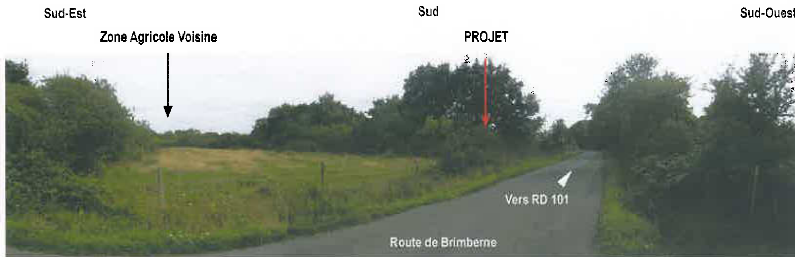
03 - Vue depuis la Route de Brimberne, vers le Sud.