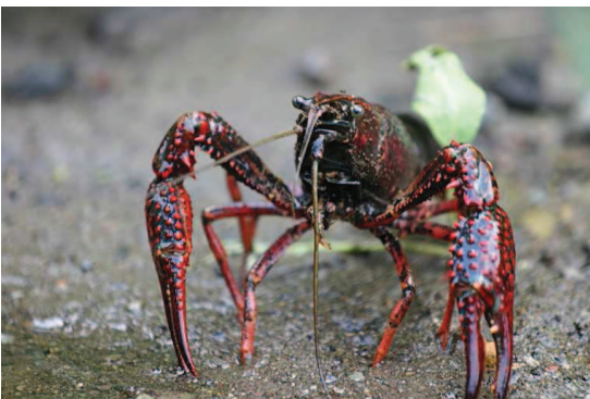
Ecrevisse de Louisiane