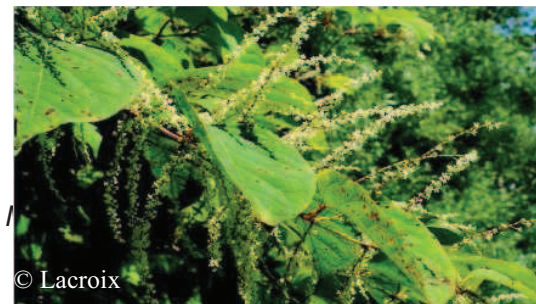
Renouée du Japon, Grandes Renouée ( Reynoutria japonica /X Bohemica )