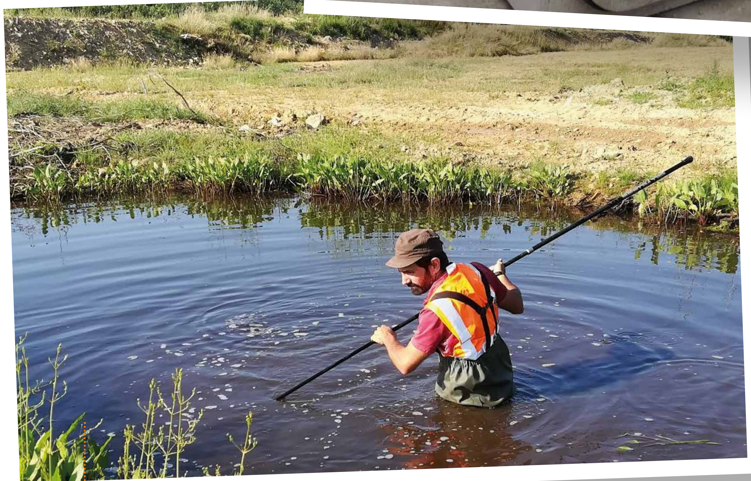
Recueil des amphibiens en vue de leur déplacement - Cabinet SEGED