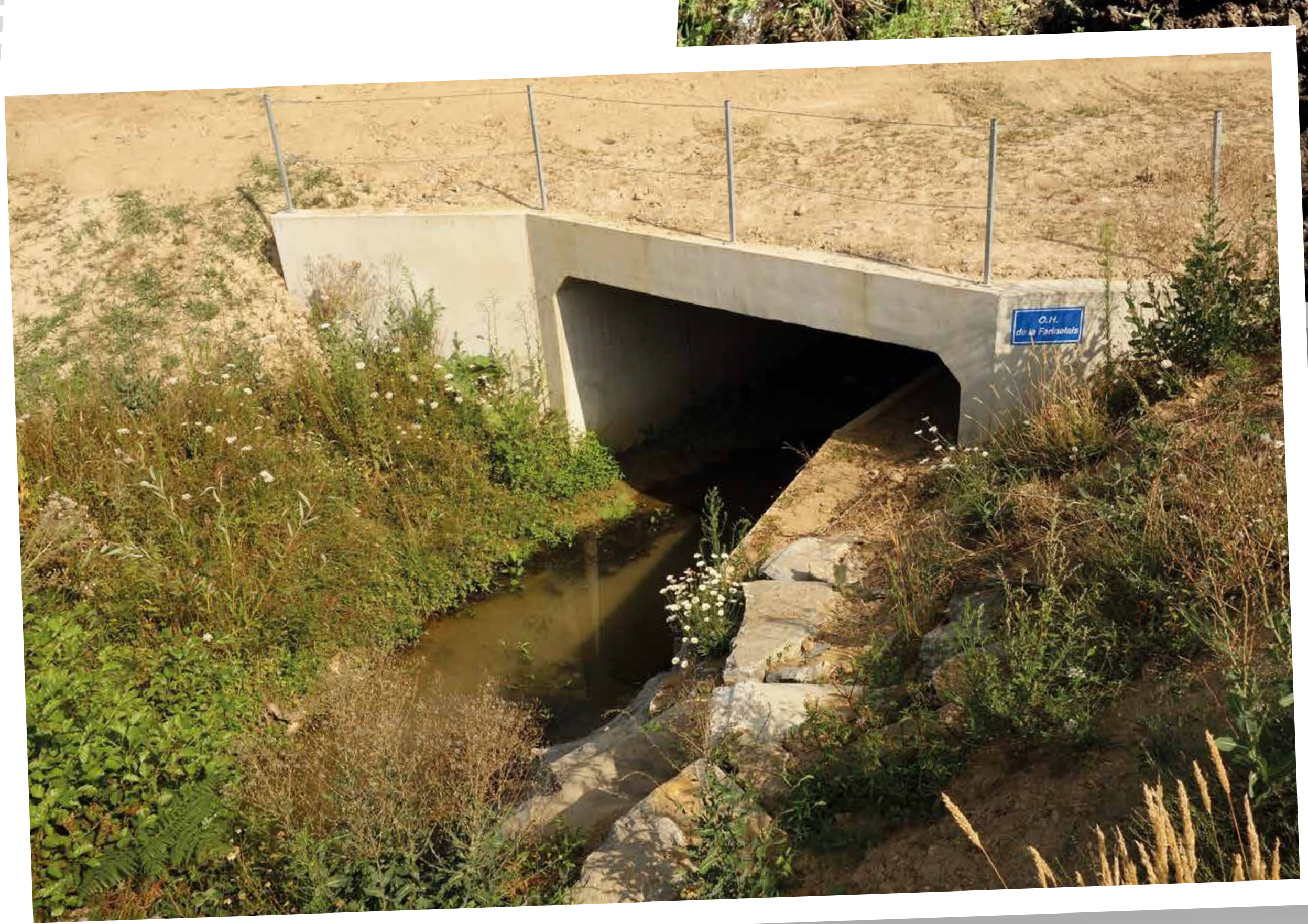
Ouvrage hydraulique du Farinelais et sa banquette