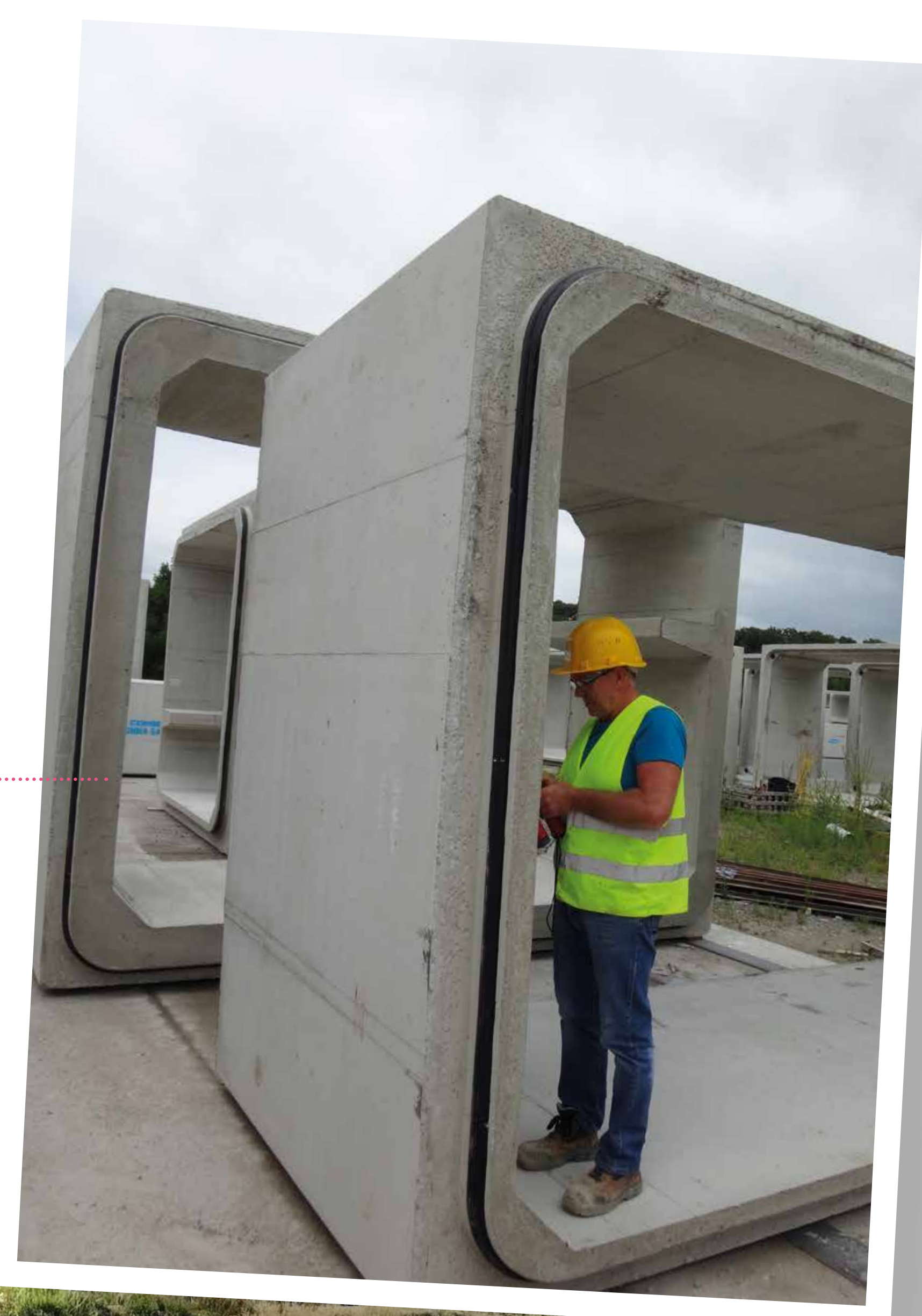
Contrôle de la fabrication d'un élément témoin - CEREMA

Les entreprises LCBTP et SPI2C ont réalisé des essais sur place ou ont prélevé des échantillons de la route par carottages qui ont été analysés en laboratoire.