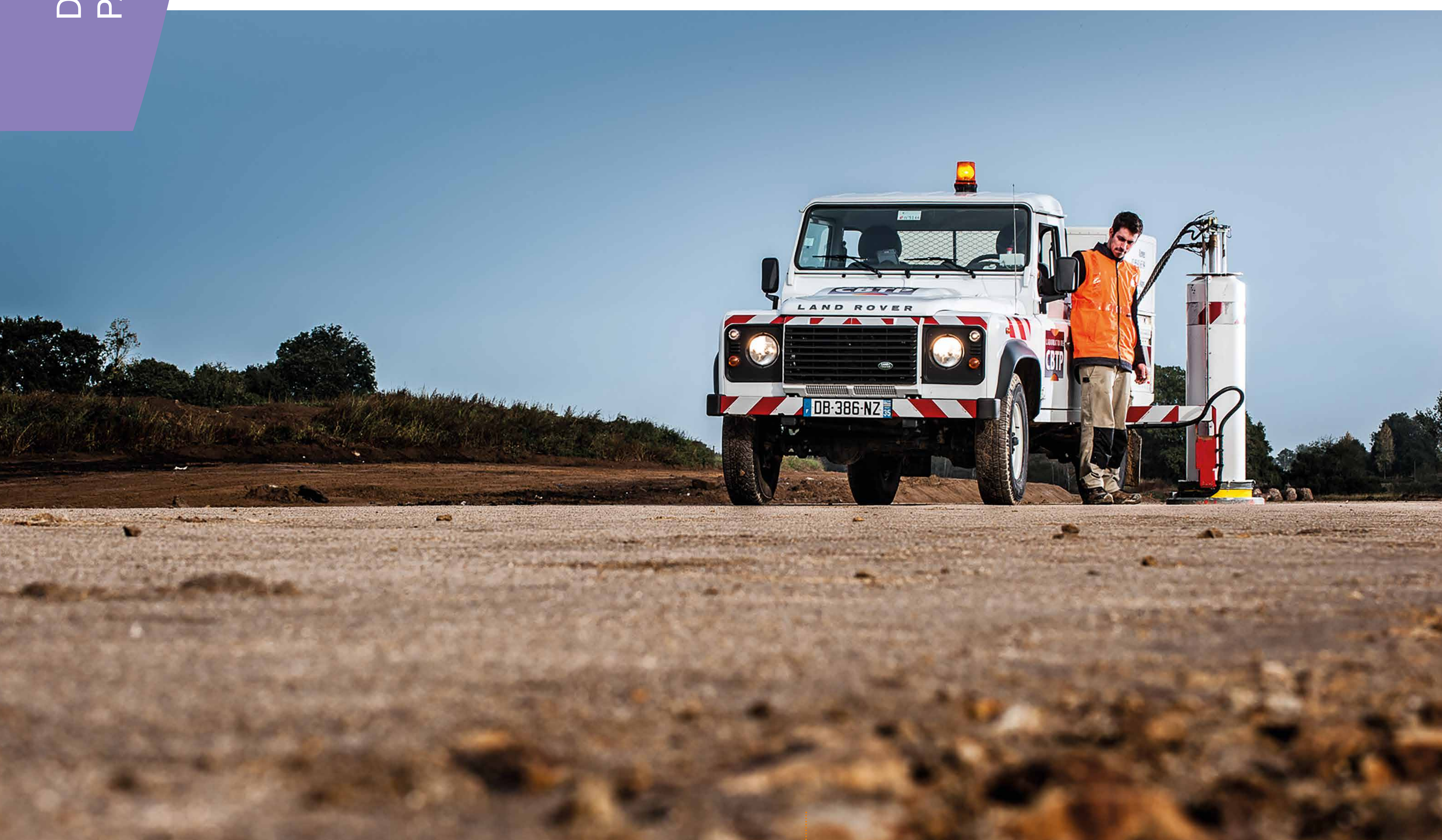
Contrôle des terrassements par le Laboratoire CBTP