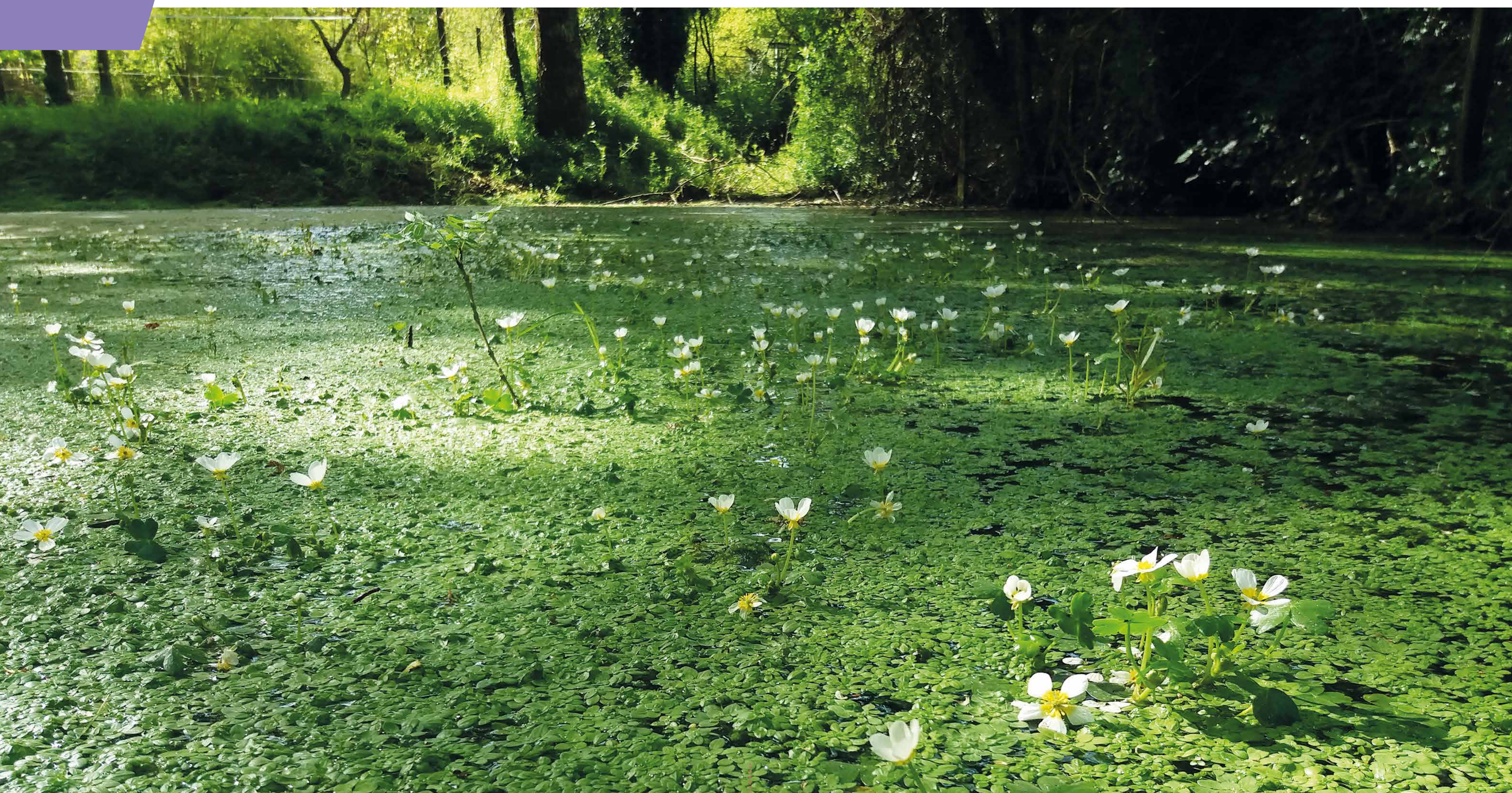
Mare accueillant plusieurs espèces de grenouilles et de libellules