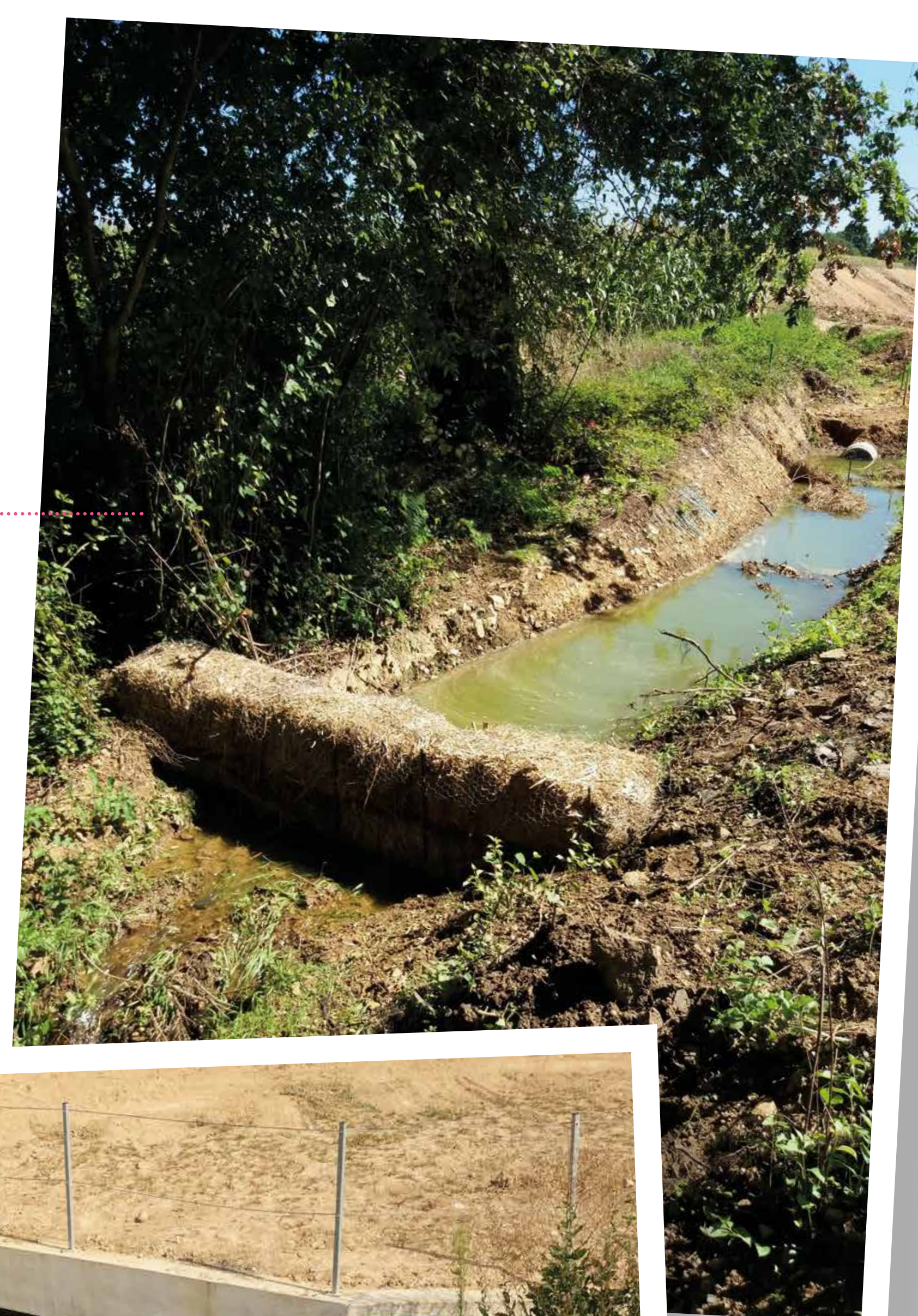
Dispositif de filtration des eaux de chantier avant rejet dans le ruisseau de La Farinelais