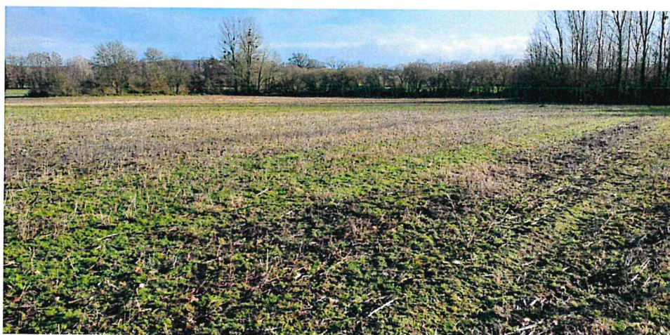
Vue depuis nord-est de la parcelle