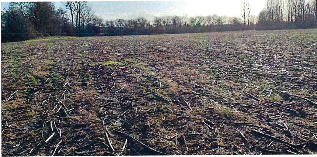
Vue depuis nord-ouest de la parcelle