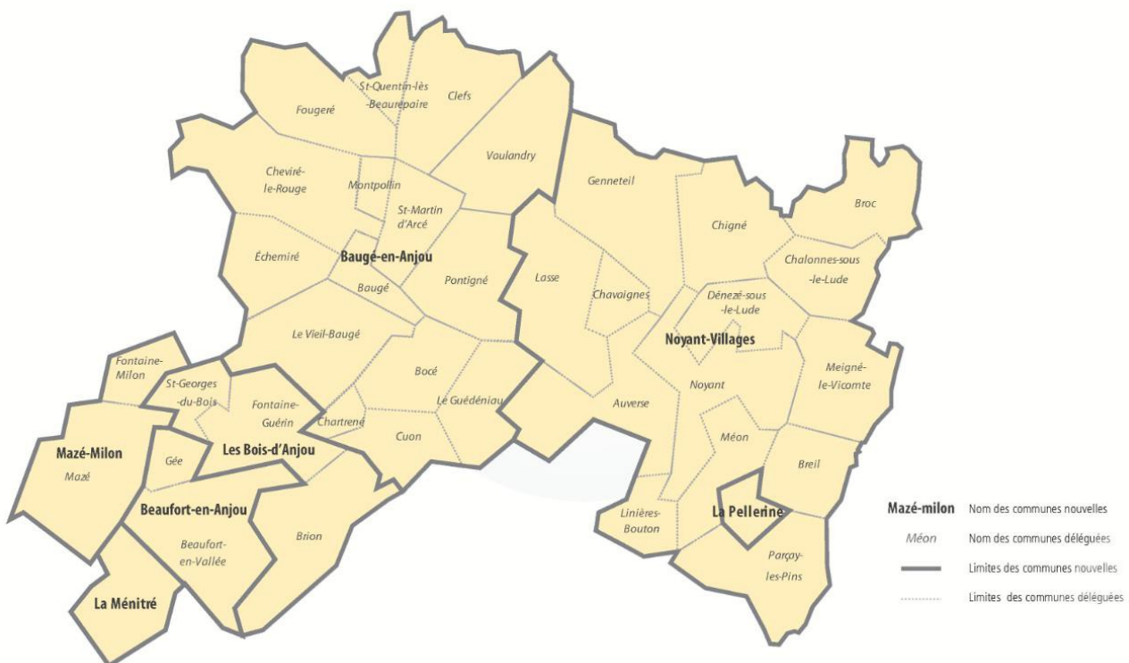
Périmètre de la CC Beaugois-Vallée (carte extraite du document de synthèse – page 5)

L'élaboration du PCAET a vocation à constituer un socle de travail et de réflexion sur les thématiques climat-air-énergie commun à l'ensemble des démarches à venir à l'échelle du territoire de la communauté de communes Beaugois-Vallées (SCoT et PLUi notamment).