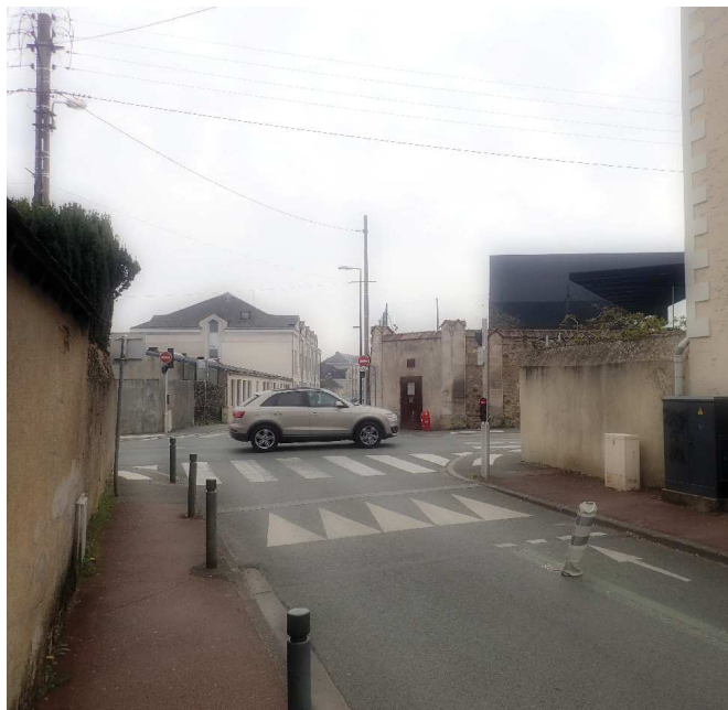
A - Vue depuis la rue de la Treille