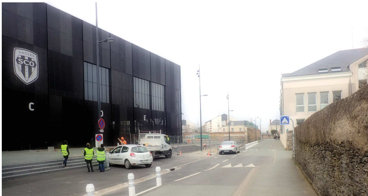
D - Vue depuis la rue du Colombier