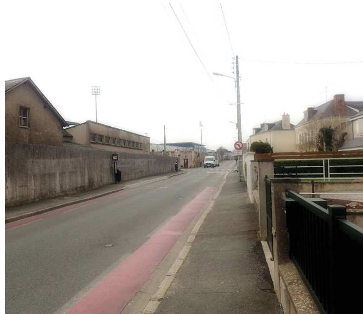
B - Vue depuis la rue St Léonard côté rue du Colombier