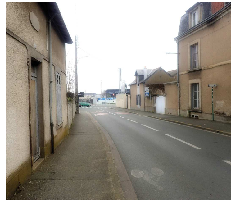
C - Vue depuis la rue St Léonard côté Boulevard de P. Coubertin