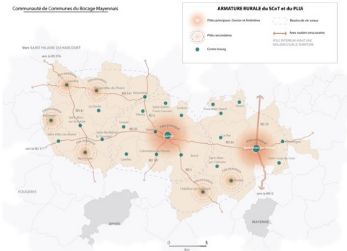
Carte extraite du PADD page 8

Situé à la croisée des trois départements de la Manche, de l'Orne et de l'Ille-et-Villaine, et à l'intérieur d'un réseau de desserte autoroutière et routière de qualité, il bénéficie également des aires d'influence de Laval et Mayenne sur sa frange sud-est, de Fougères et Ernée sur sa frange sud-ouest.