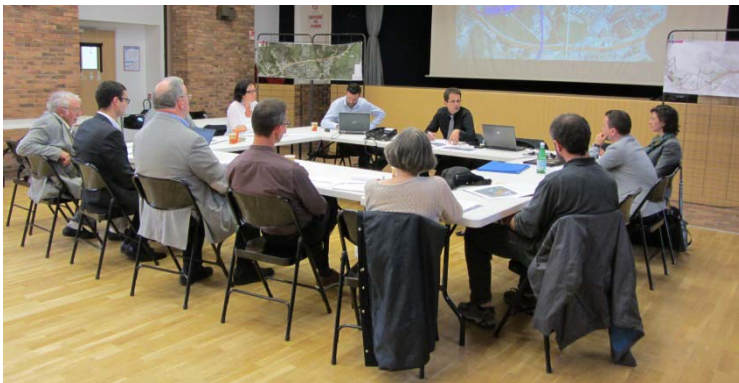
Atelier thématique patrimoine