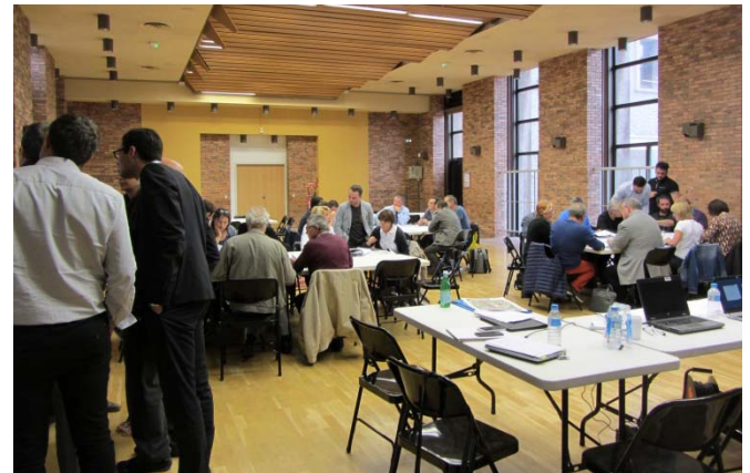
Atelier thématique cadre de vie