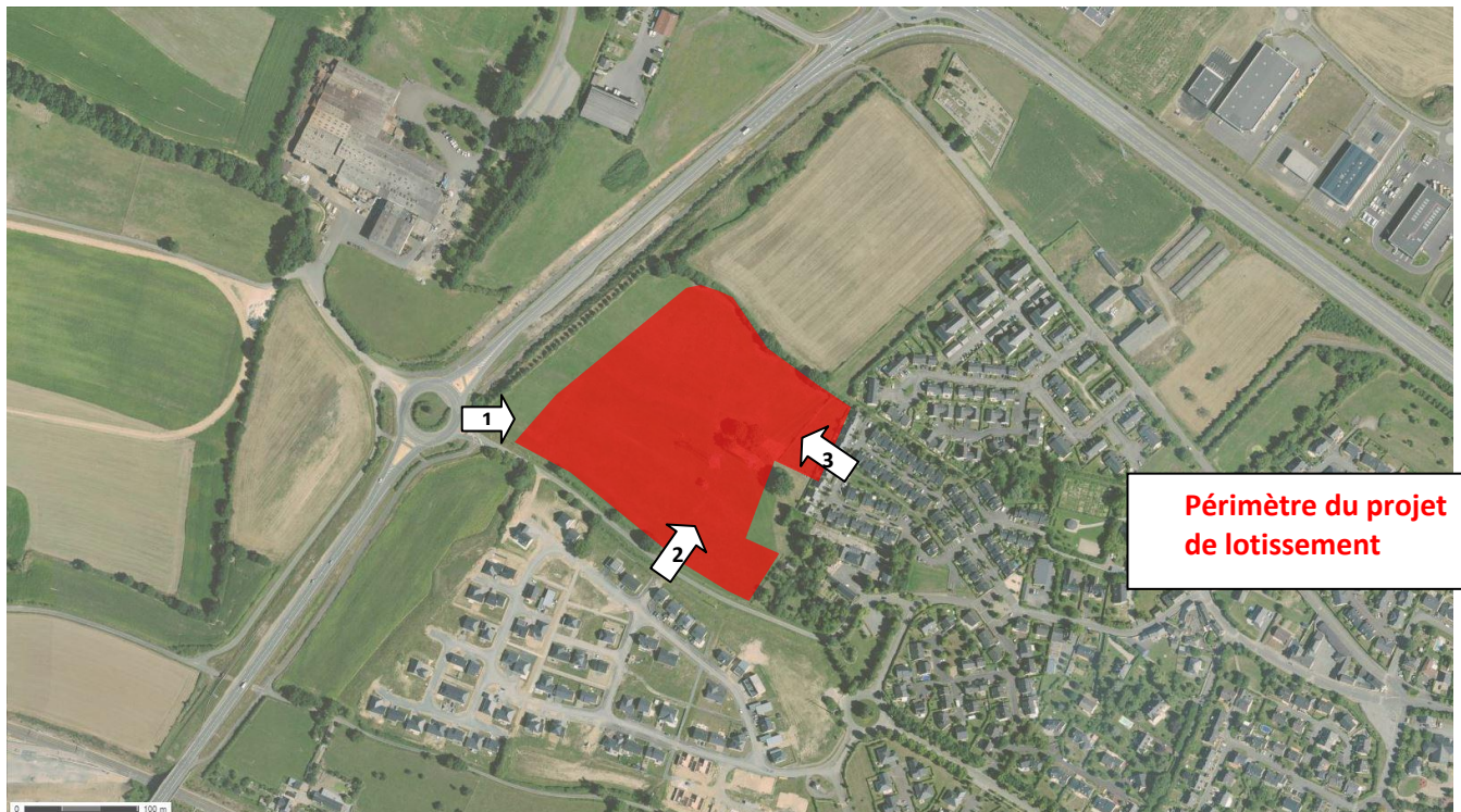
Localisation des abords