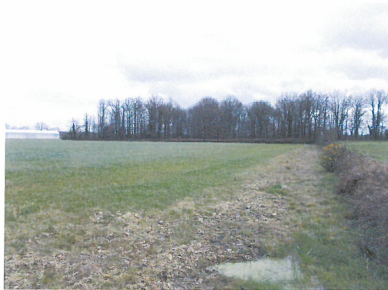
Photo du boisement classé au PLU

Le projet de serres sera édifié dans le contexte paysager du site avec des serres et une exploitation existantes.