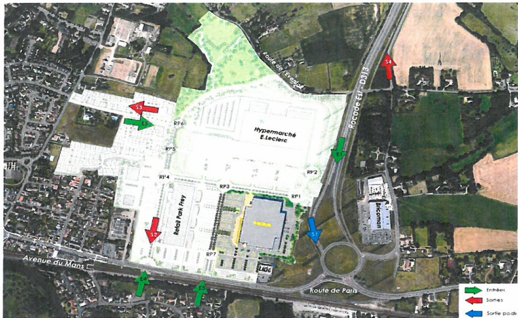
Figure 3 : Plan des accès automobiles

Le dossier de déclaration de projet valant mise en compatibilité des PLU de la ville du Mans et de la commune d'Yvré-l'Evêque a été approuvé par le conseil communautaire de Le Mans Métropole par délibération du 4 juin 2015. Par ailleurs, le projet a fait l'objet d'un avis favorable de la commission d'aménagement commercial du 2 septembre 2014.