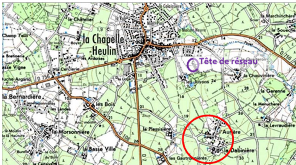
Figure 9 : Villages de l'Aurière et la Dabinière

Au vue des contraintes spécifiques, l'Agence de l'Eau pourrait éventuellement considérer un financement de ce transfert.